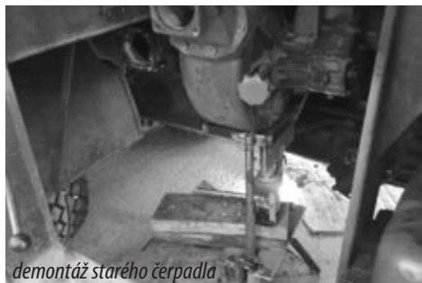
demontáž starého čerpadla

V sobotu 31.3.2012 Jiří Neudert, Jaroslav Neudert a Jaroslav Nečas namontovali čerpadlo do vozidla, které tak mohlo být opět uvedeno do provozu. Na opravě, demontáži starého čerpadla a montáži nového čerpadla bylo celkem odpracováno 130 hodin. Děkuji touto cestou všem, kteří se na vyřešení tohoto problému podíleli.